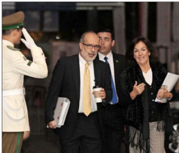
A las 7:30 de la mañana llegaron los ministros de Hacienda, Rodrigo Valdés, y de Trabajo, Alejandra Krauss, a entregarle el informe a la Presidenta.

Este escenario complicará el horizonte para un eventual proyecto de ley. Cercanos a las tratativas con los partidos políticos y