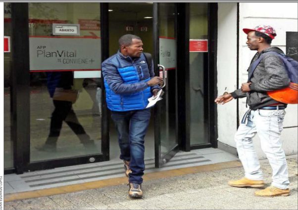
Si los extranjeros no vienen al país a hacer el trámite para solicitar su pensión, los fondos quedan en las AFP bajo propiedad de esa persona a la espera de que los retire.

dente zanjará los temas que entrarán en la reforma previsional y cuáles no. Entre los temas en que se han avanzado con fuerza, y que se analizarán en la reunión de hoy, están los incentivos a quienes coticen después de la edad legal, que permitirá a esa persona retirar cierto monto en efectivo cuando se jubile, y el reajuste extraordinario a la pensión básica solidaria, señalaron fuentes del Gobierno. Uno de los temas que también estaría evaluando el equipo técnico a cargo de la reforma es la situación previsional de los inmigrantes que cotizan en Chile y su situación en caso de que se va-