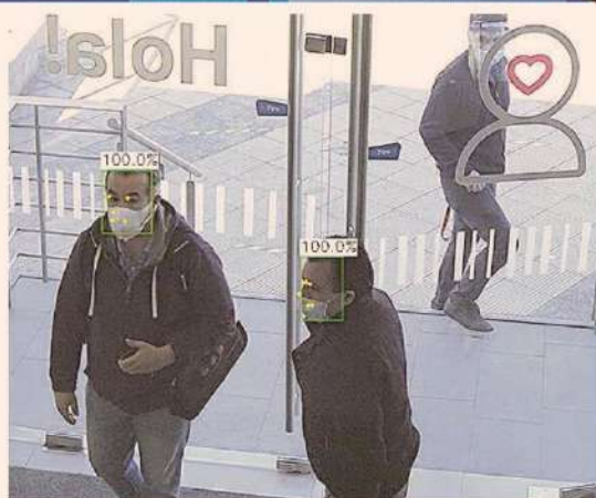
Entel implementó video analytics con inteligencia artificial para monitorear cumplimiento de medidas sanitarias en sucursales.